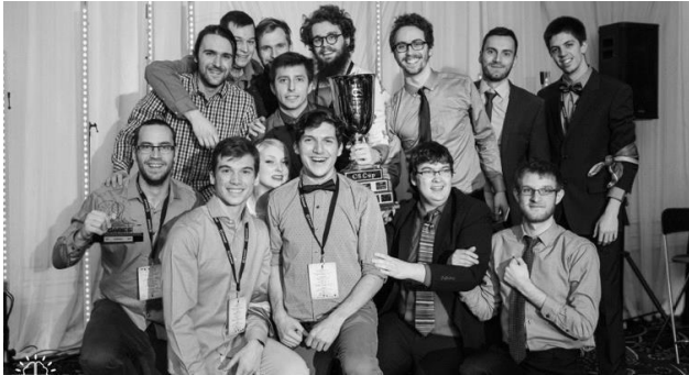
CS Games, mars 2017.

Finalement, nous encourageons et diffusons sur les médias sociaux les activités externes qui sont d'intérêt pour nos membres tels que les meetups, les hackathons et autres.