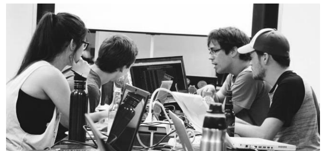
iHack Sherbrooke, juin 2017.