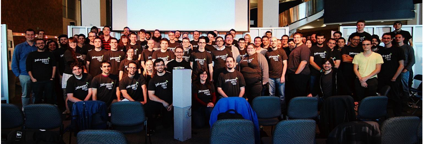
JDISConf 2017. Octobre 2017.

Afin de continuer à offrir toutes ces belles activités, nous avons besoin de votre soutien!