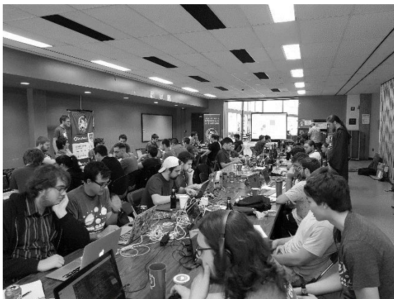
JDISGames, mai 2018.

Nous considérons comme membres toutes les étudiantes et tous les étudiants qui participent à au moins une activité de JDIS durant l'année. Suivant cette définition, nous comptons approximativement 300 membres. Ceux-ci étudient majoritairement en science et génie informatique. Dû au fonctionnement de notre groupe, les membres participent aux activités suivant leurs champs d'intérêt. Tous les membres suivent néanmoins les nouvelles et informations de la communauté.