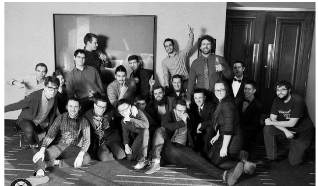
CS Games, mars 2018.