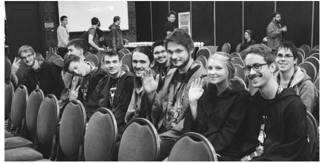
HackFest Québec, novembre 2016.

Nous supportons également financièrement et logistiquement la création des délégations de l'Université de Sherbrooke aux différentes compétitions informatiques. Lorsque le nombre d'inscriptions n'est pas limité, nous encourageons tous nos membres, peu importe leur niveau, à se joindre aux délégations. De plus, nous offrons de façon ponctuelle du mentorat afin de préparer nos membres aux compétitions.